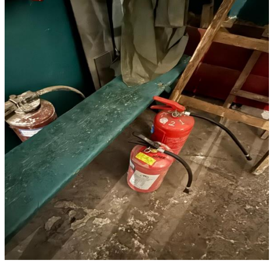
Φομο № 8