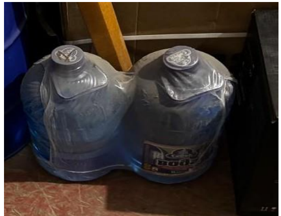
Φομο № 10