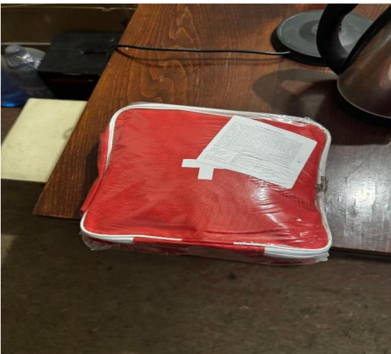
Φομο № 11