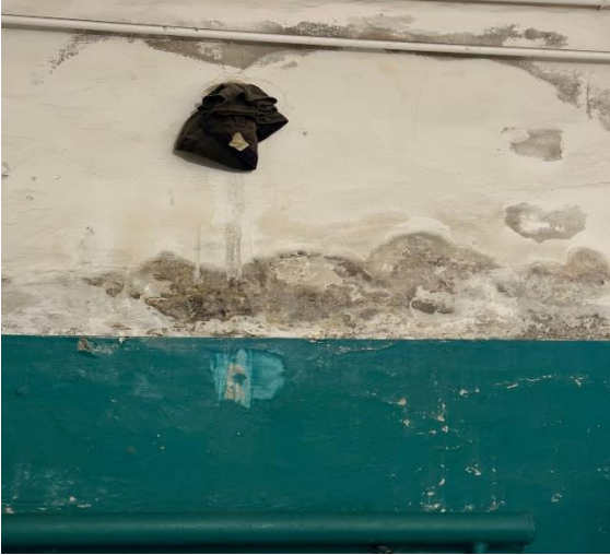
Φομο № 7