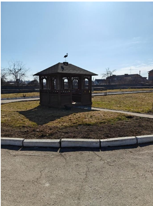
фото № 3