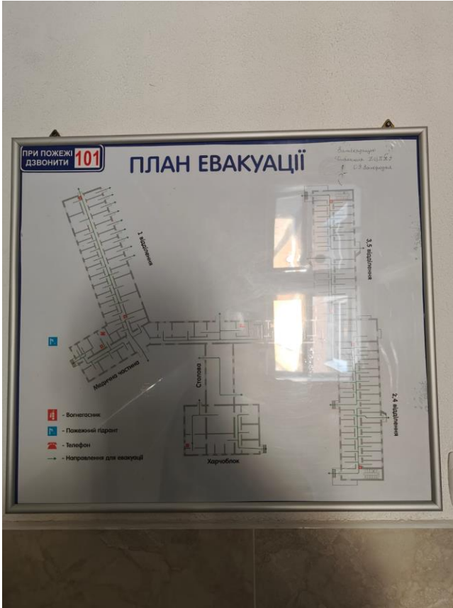
фото № 5