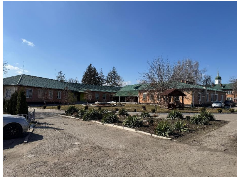
фото № 2