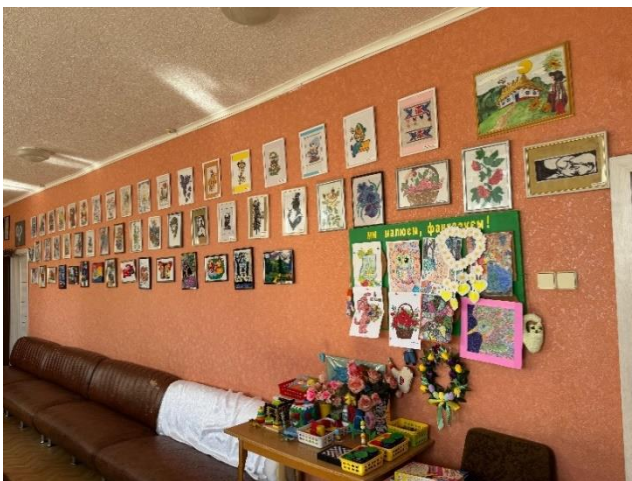
фото № 7