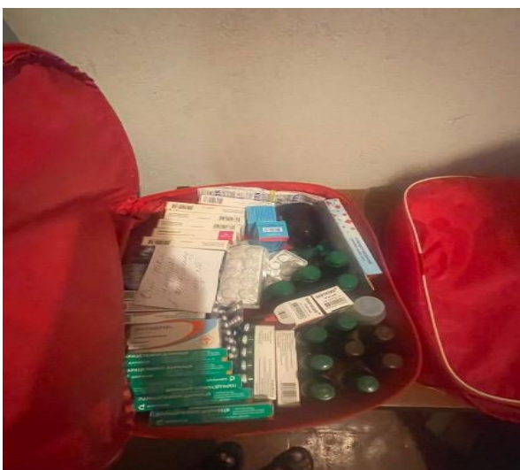
Фото № 11