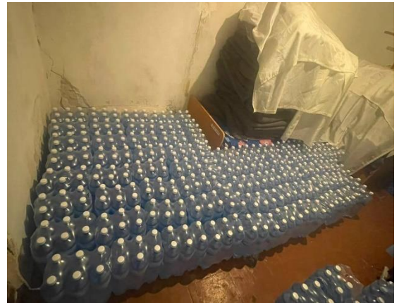
Фото № 10