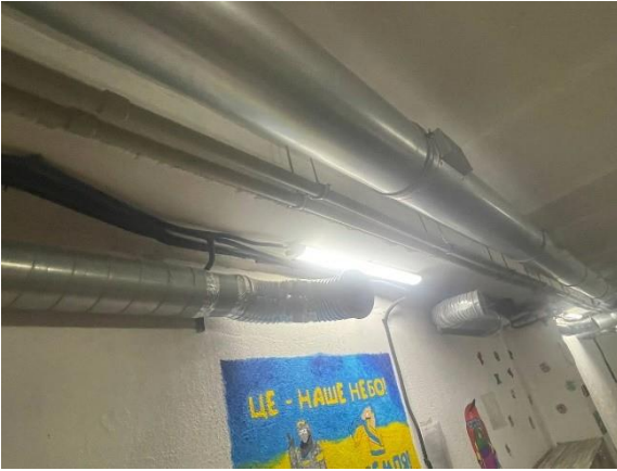
Фомо № 13