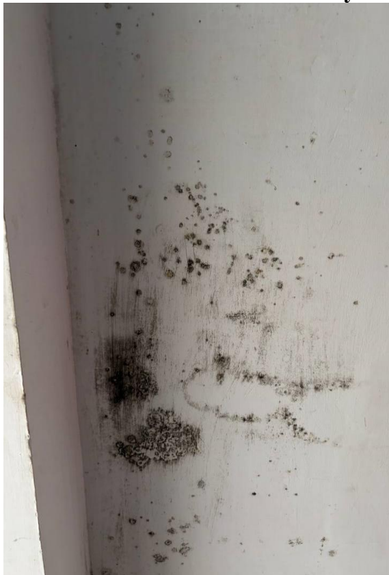
Фото умов проживання в МТП