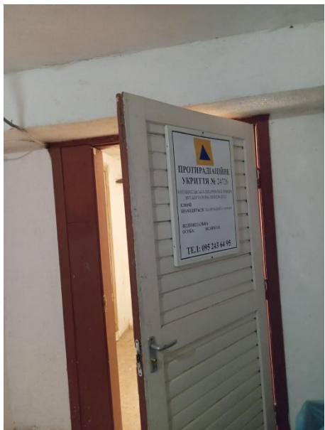
Φοτο Νο 5