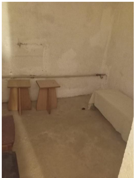
Φοτο Νο 7