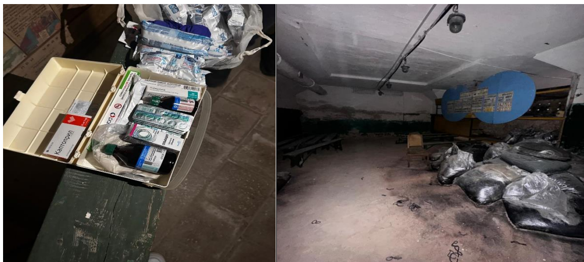
ФОТО № 5-6

Рекомендації за результатами моніторингового візиту до об'єкта Фонду захисних споруд цивільного захисту Житомирської філії АТ «Укртелеком», вул. Київська, 22, м. Житомир.