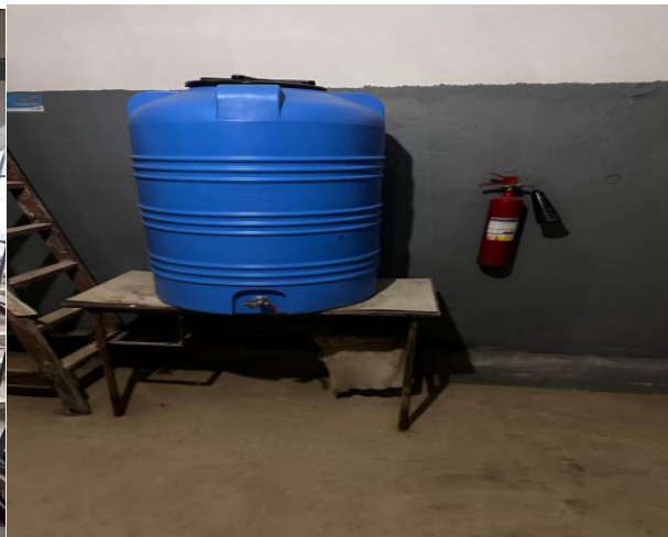
ФОТО № 1-2