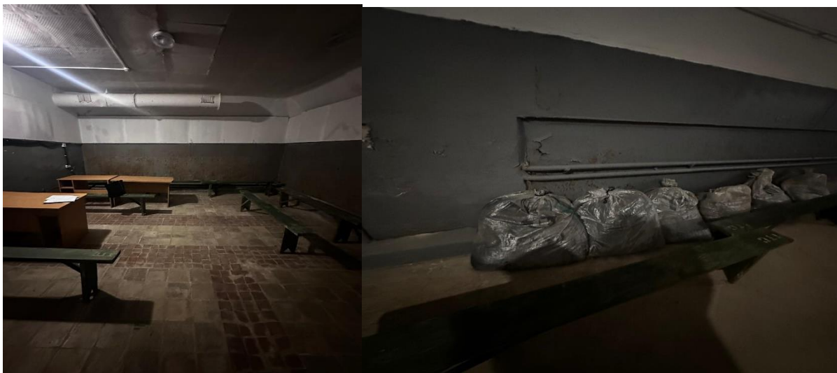
ФОТО № 3-4