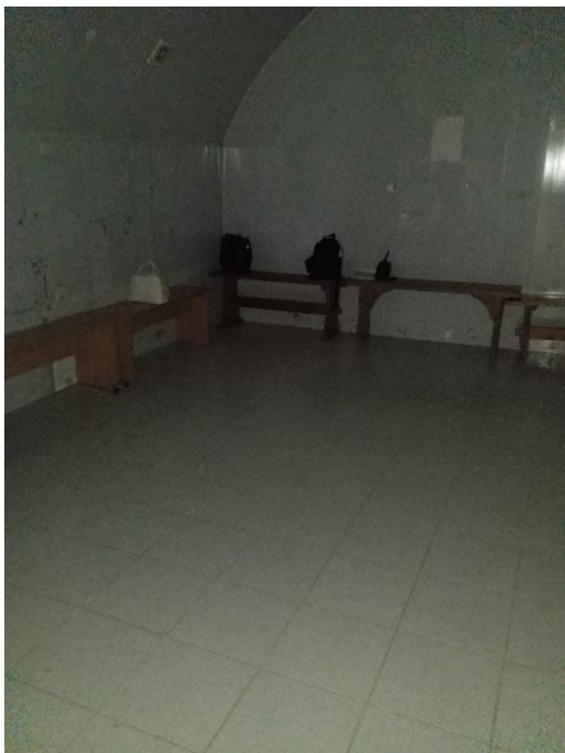
Φοτο Νο 5