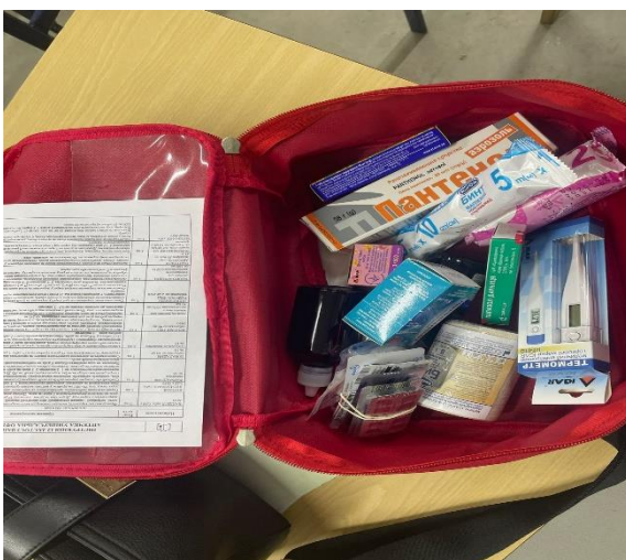
Фото № 11