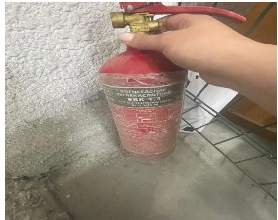
Фото № 10