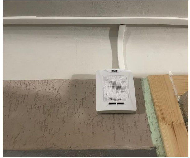
Фото № 14