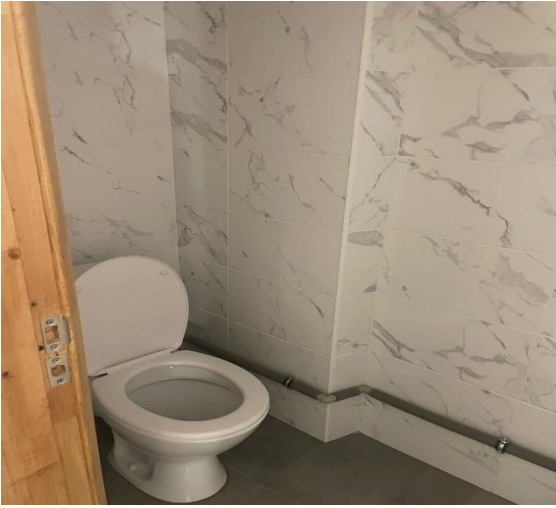
Фото № 13