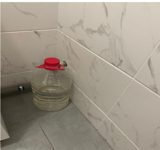
Фото № 11