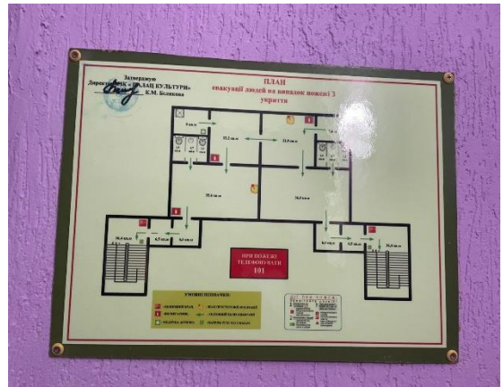
Фото № 10