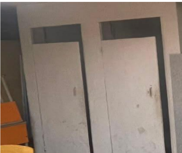
Фото № 11