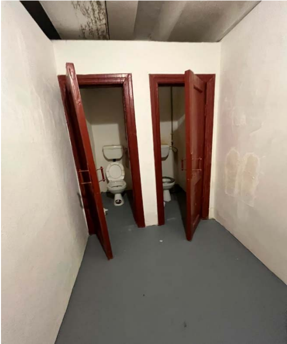
Фото 5) 02.07.2026