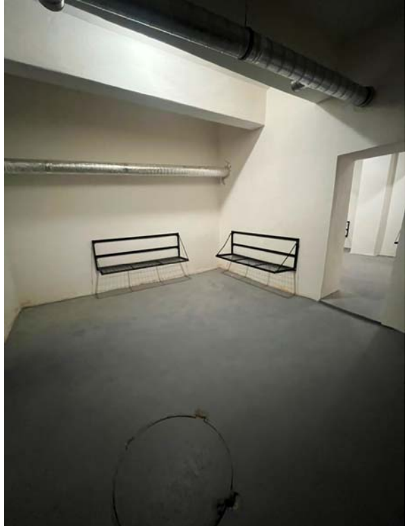
Φωτο 4) 02.07.2026