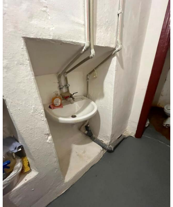
Фото 6) 02.07.2022