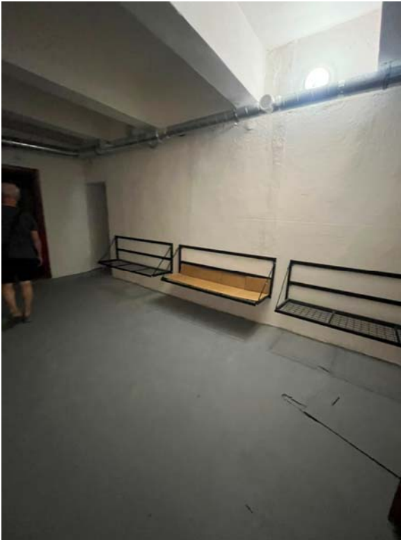
Фото 7) 02.07.2026