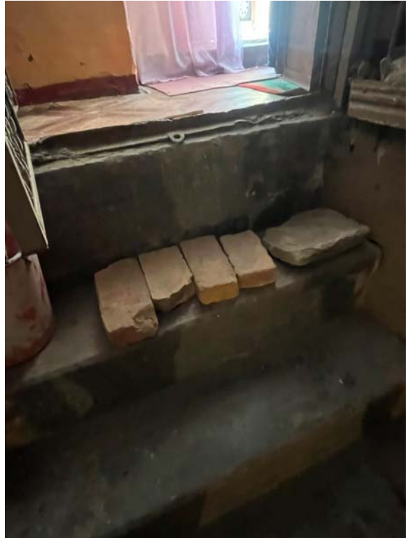
Φωτο 2) 02.07.2026