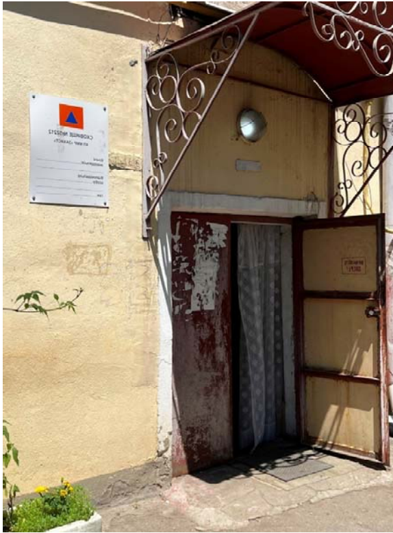
Φωτο 1) 02.07.2026