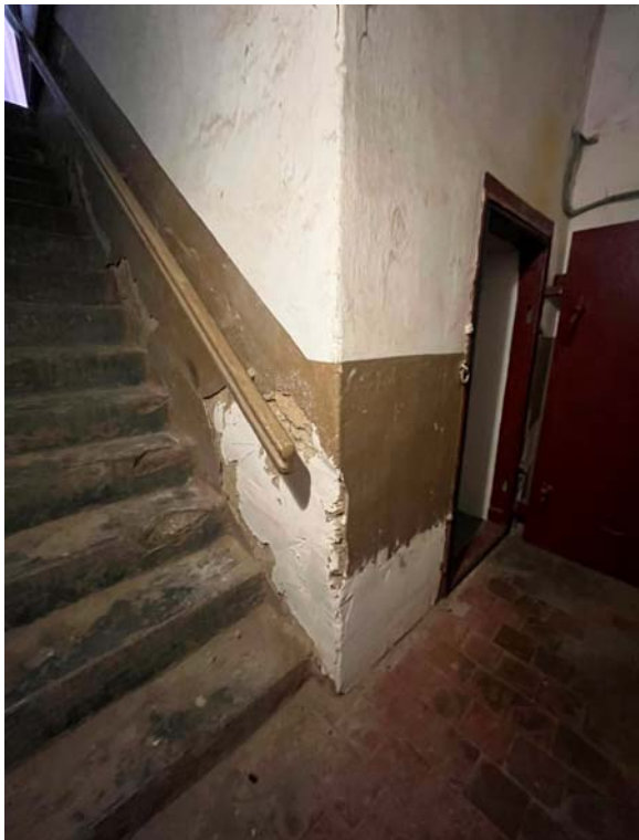
Φωτο 3) 02.07.2026