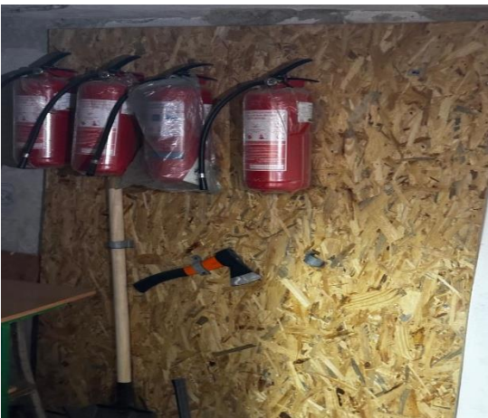
Фото № 11