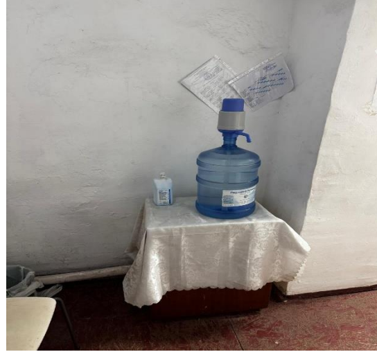
Фото № 14