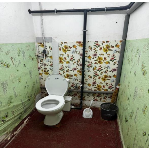
Фото № 17