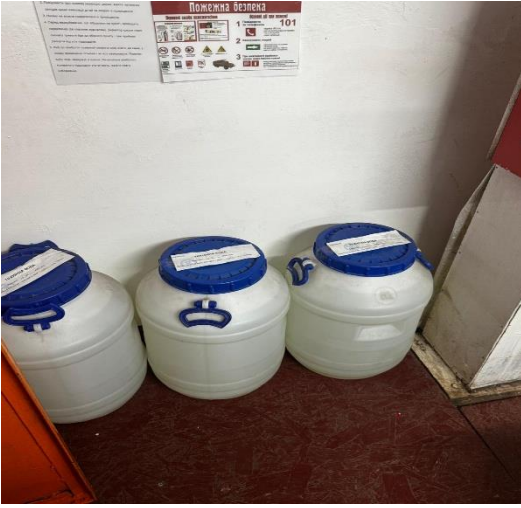
Фото № 13