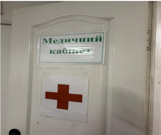
Фото № 15