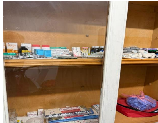
Фото № 16