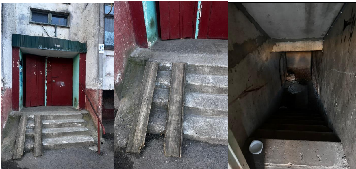
Фото № 1-2