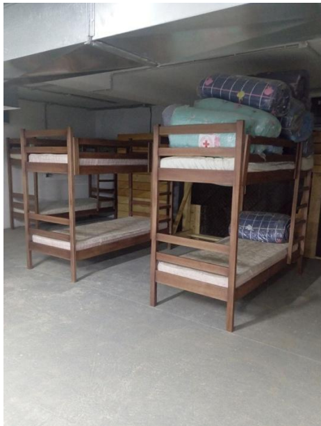
Φοτο Νο 7