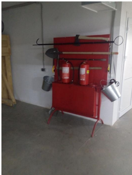
Φοτο Νο 5